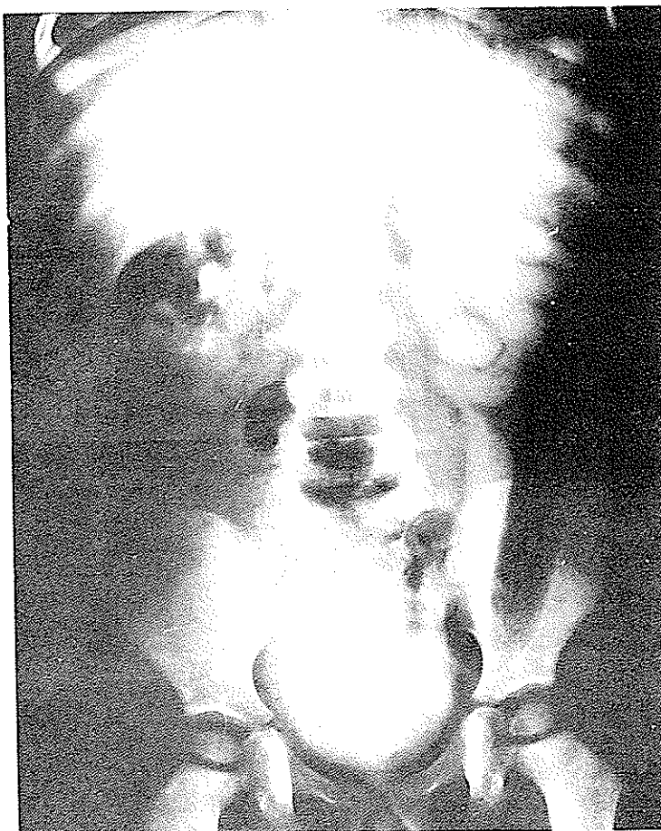
۱- اریوگرافی داخل وریدی هیدروارترو نفروز در سمت چپ را نشان میدهد