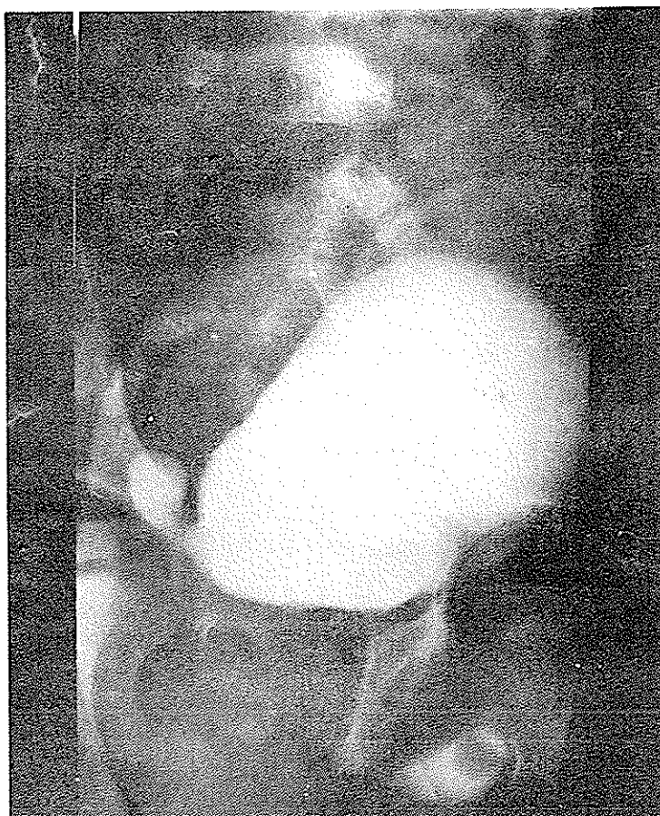
۴- دیورتیکول ممانه و بیشابراه مشخص می باشد .